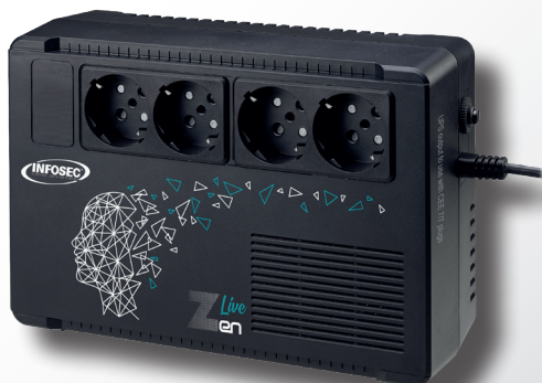
Zen Live 500/650 VA

* Dependiendo del modelo y la carga conectada