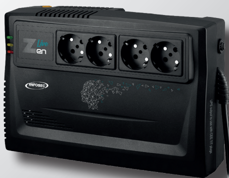
Zen Live 800/1000 VA