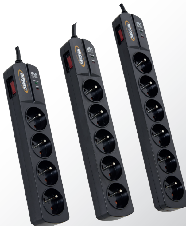
S4 Black Line II