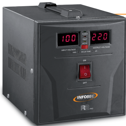
R2 Pro 1500VA - 2000VA

Les Régulateurs Infosec R2 Pro constituent des solutions fiables et résistantes pour protéger les équipements électriques de 1 000 à 20 000 VA.