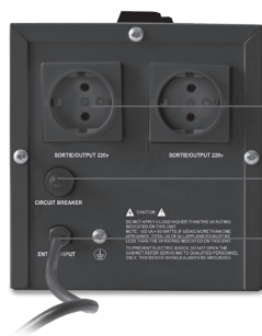
R2 1000 / 1500 / 2000VA