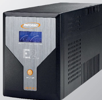
HERO Pro Dual Plug 2400