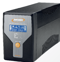
HERO Pro Dual Plug 700

Une réelle économie d'énergie est ainsi réalisée grâce à ce chargeur de batterie évolué qui permet la recharge des batteries deux fois plus vite !