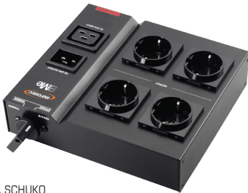
BMe1 FR & SCHUKO

Disponibles en format Tour et format rackable 19", ils sont proposés en différents types de prises.