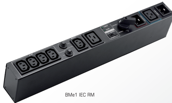
BMe1 IEC RM