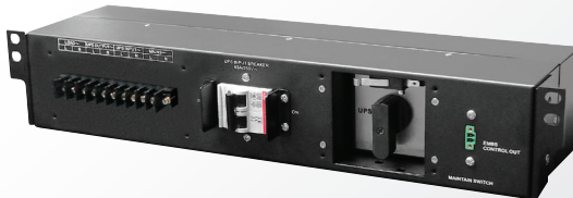
BMe 2 RM

Infosec vous propose : le BMe2 RM, compatible avec le E3 Performance 5000 RT et le E7 One RT de 6 & 10 kVA le BMe2 TM RM, compatible avec le E6 LCD TM RM 10 kVA.